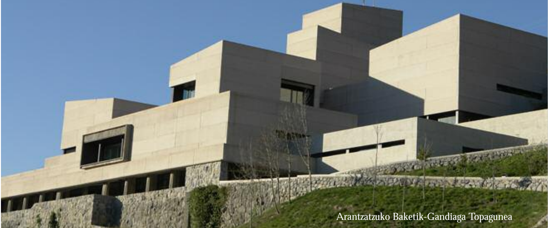
Arantzazuko Baketik-Gandiaga Topagunea

Arantzazuko Baketik bakearen zentroan lau urtez egindako lana laburbiltzen duen terminoa da Bizizikasi. Metodologia berritzaile bat du abiapuntu eta bere jarduerak eta proiektuak gidatzen dituen berrikuntza etikoaren motorra da. Labur azadulta, bizizikasi bizitza hobetzeko pedagogia bat da, eta jada ikasturte honetan Baketik-eko ikastaroen euskarri nagusia da.