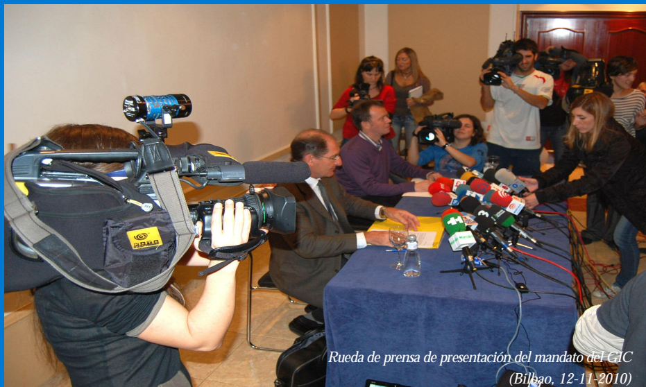
Rueda de prensa de presentación del mandato del GIC (Bilbao, 12-11-2010)